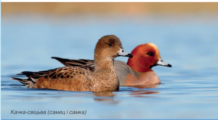
Качка-свіцтва (самец і самка)

2 За перыяд вясновай міграцыі дадзеным шляхам пралятае больш за 60 000 птушак. Найбольш шматлікія з іх – белалобая гусь, гусь-гуменніца, качка-свіцтва, крыжанка, качка-шылахвостка, кнігаўка.