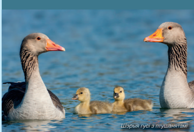
Шэрыя гусі з птушанятамі