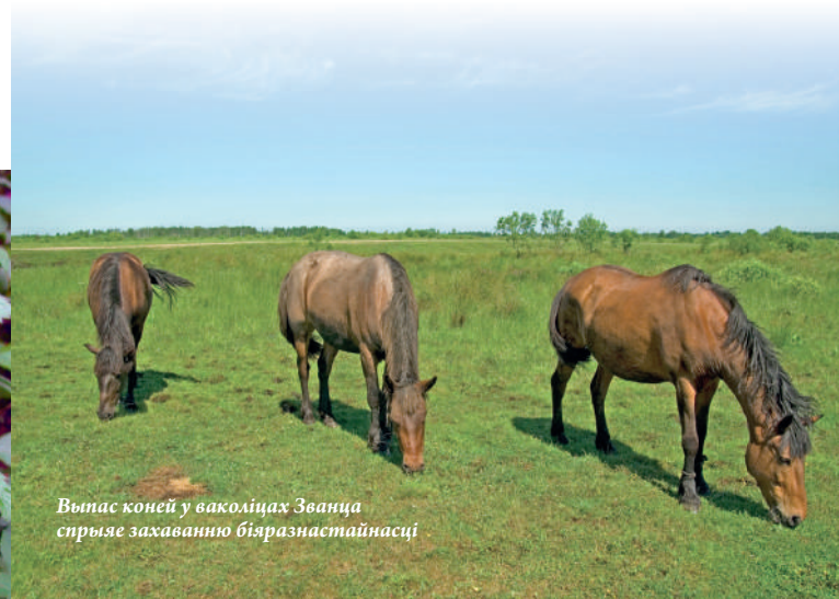
Выпас коней у ваколіцах Званца спрыяе захаванню біразнастайнасці