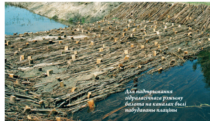
Для падтрымання гідралагічнага рэжыму балота на каналах былі пабудаваны плаціны