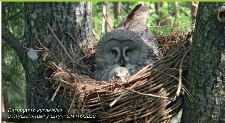
Барадая кугакаўка з птушанятамі ў штучным гняздзе