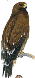
Большой подорлик (минимум 2 пары)