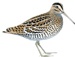
Дупель (минимум 20 самцов)