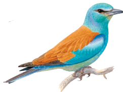
Сизоворонка (минимум 10 пар)