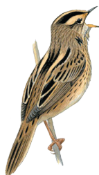
Вертлявая камышовка (минимум 10 самцов)