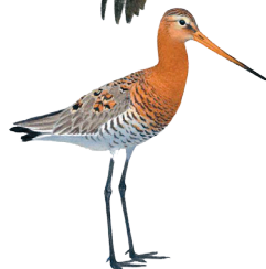
Большой веретенник (минимум 10 пар)